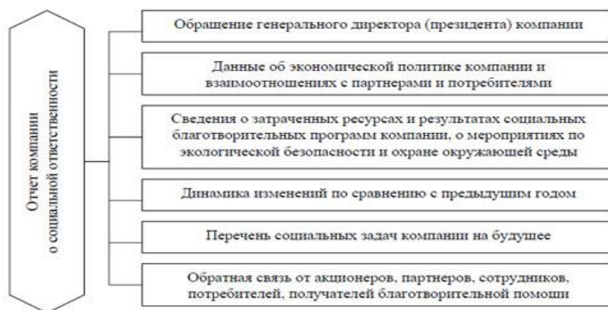
Рисунок 2 – Составляющие (нефинансового) социального отчета

Более наглядно составляющие нефинансового отчета изображены на рисунке 2 35 .