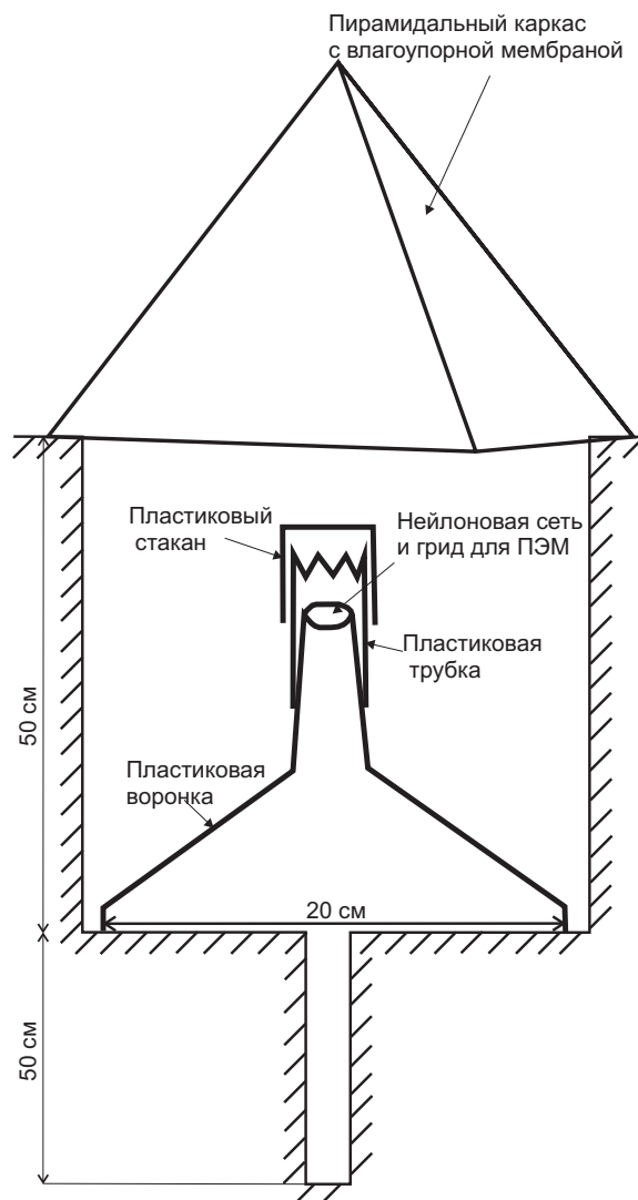
Рис. 2. Метод сбора наночастиц на искусственную аккумулятивную систему

в почвенной атмосфере, использовались специальные коллекторы, являющиеся модификацией устройств, предложенных шведскими учеными [23, 26]. Главным отличием данного исследования являлось осаждение наноразмерных частиц на специальных сеточках и их изучение при помощи просвечивающей электронной микроскопии (ПЭМ). Это позволило установить минеральные формы наночастиц, которые по своему химическому составу были одинаковы с минеральным составом рудного тела, что напрямую доказывает миграцию наночастиц с геогазом с различных глубин вплоть до дневной поверхности. По результатам этих исследований удалось зафиксировать над рудными телами различные минеральные формы Pb и Cu размерностью от 10 до 300 нанометров и с хорошей корреляцией по генезису с рудным телом.