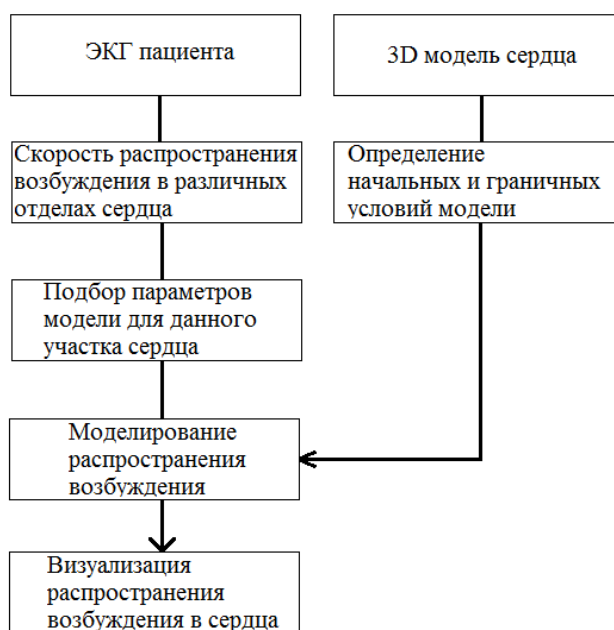
Рис. 3. Алгоритм моделирования процесса распространения возбуждения в сердце.

Для реализации моделирования процесса распространения возбуждения в сердце, в рамках концепции оценки состояния сердечно-сосудистой системы (ССС), на базе лаборатории № 63 института неразрушающего контроля предполагается разработка аппаратно – программного комплекса. Алгоритм работы АПК представлен на рисунке 3.