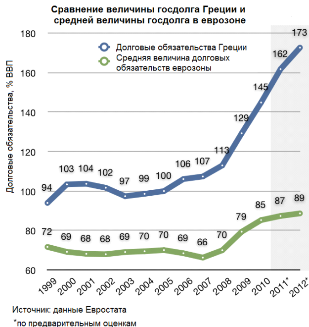
Рис. 1. Процентное отношение госдолга Греции к ВВП начиная с 1999 г. по сравнению со средней величиной госдолга в еврозоне

день она вынуждена их импортировать. Аналогичное положение сложилось и в промышленности. Так, экономика Греции до ЕС поддерживалась работой многих предприятий. В их число входило и несколько крупных фабрик по производству трикотажа, которые на сегодняшний день закрыты.