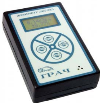
Рис. 1. Дозиметр ДКГ-03Д «Грач»

Известно, что строительные материалы, такие, как гранит и глинозём, щебень, бетон и газосиликатные блоки, имеют повышенный радиационный фон. Кирпич является менее радиоактивным строительным материалом, чем железобетонные панели. Мы решили в этом убедиться сами и начали свой эксперимент с замера радиационного фона в панельном доме и в кирпичном доме, причем были выбраны девятиэтажные дома для того, чтобы сравнить радиационный фон на нижних и