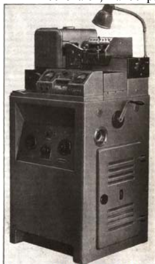
рис. 1. Электроэрозионный станок

Все знают, какое разрушительное действие может произвести атмосферный электрический