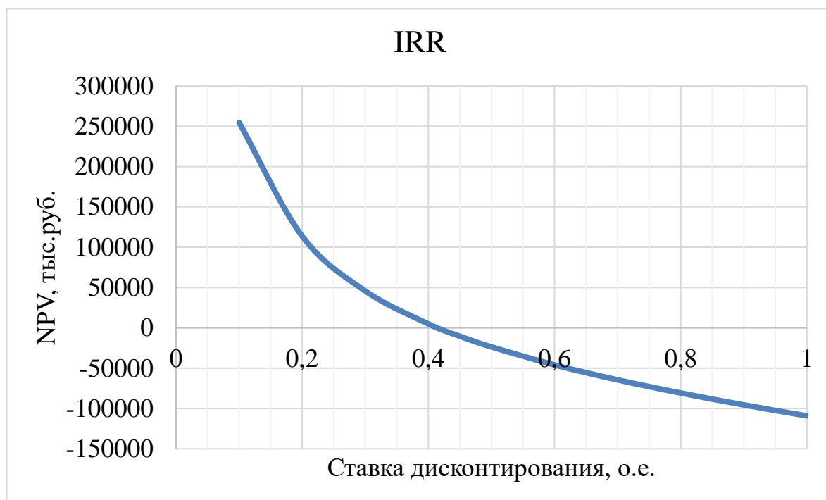
Рисунок 5.4.1.1 – Внутренняя норма доходности.

IRR - процентная ставка, при которой чистая приведённая стоимость равна 0.