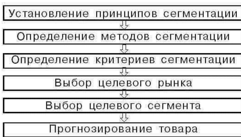
Рисунок 4. Общая схема сегментации рынка 20

Подобная схема сегментации рынка носит общий характер и может быть применена при планировании различных направлений маркетинговой деятельности.