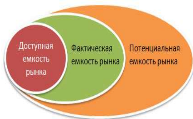
Рисунок 5. Виды емкости рынка 28

Часто в маркетинге вместо понятия «емкость рынка» используются его синонимы: размер и объем рынка. В общемировой практике выделяют 3 вида емкости рынка: фактическая, потенциальная и доступная. Каждый вид емкости рынка можно рассчитать в различных единицах измерения: в натуральном выражении (штук), в стоимостном выражении (в юанях), в объеме товара (литров, килограммов и т.п.) (рис.5).