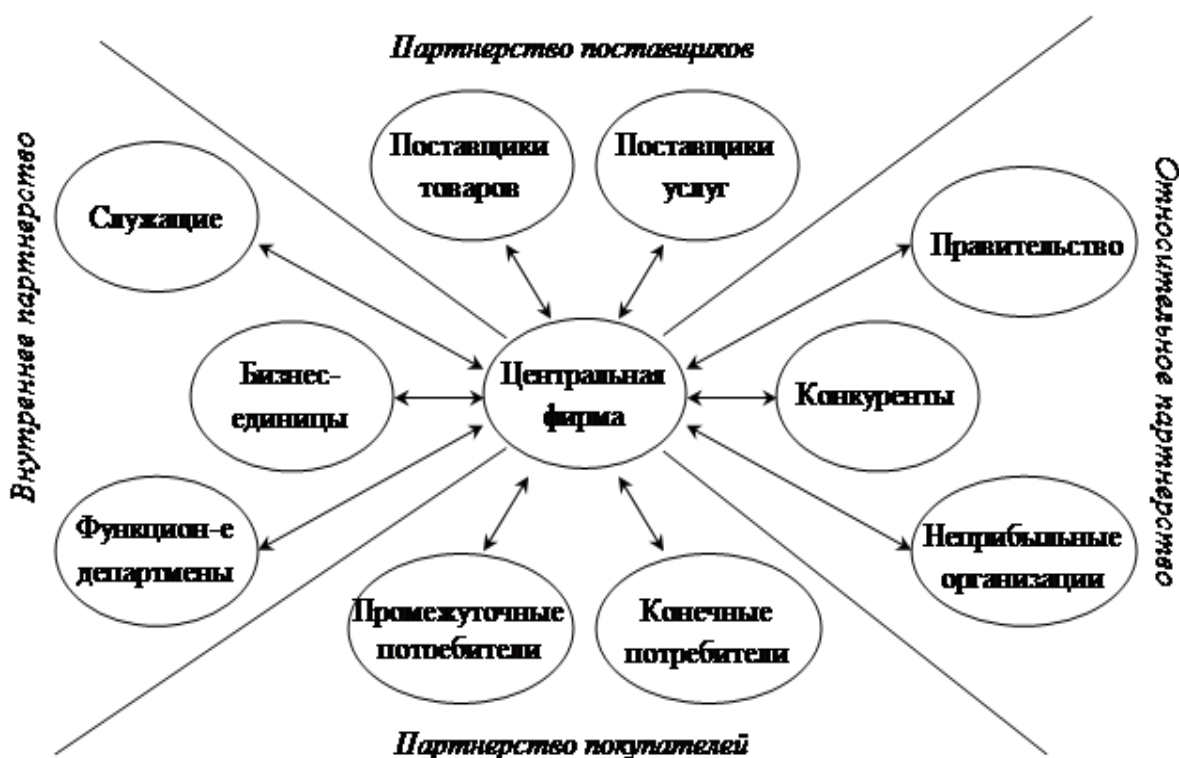
Рисунок 1 - Виды партнерства относительно центральной компании

1. партнеры компании. Данную аудиторию разделяют на несколько групп, среди которых наиболее распространенные – это категории поставщиков, торговых посредников, специалистов по товародвижению и маркетинговым услугам, консультантов, аудиторов, кредитно-финансовых учреждений, компаний-аутсорсеров, занимающихся ведением бизнеса и производства, некоммерческих организаций, международных и иных партнеров.