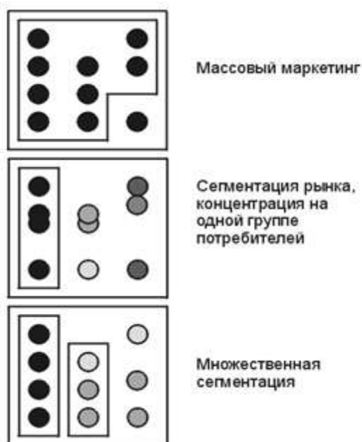
Рисунок 2. Варианты сегментирования на предприятии 16

Процесс сегментации имеет для фирмы стратегическое значение, поскольку приводит к определению области ее деятельности и к идентификации факторов, ключевых для достижения цели. Каждая фирма, выходящая на рынок, должна определить для себя, будет ли она предлагать товары и услуги всем возможным потребителям, либо сфокусируется на отдельных целевых группах, предлагая решения, адаптированные к специфическим проблемам. С этой точки зрения возможны три вида стратегии маркетинга 17 :