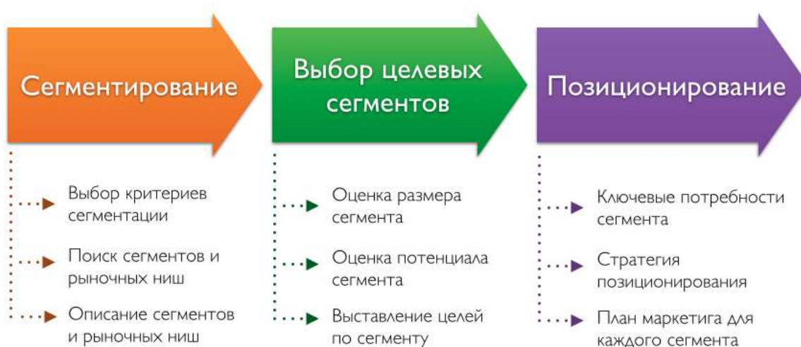
Рисунок 3. Основные мероприятия целевого маркетинга 19

Целевой маркетинг требует проведения трех основных мероприятий (рис. 3)