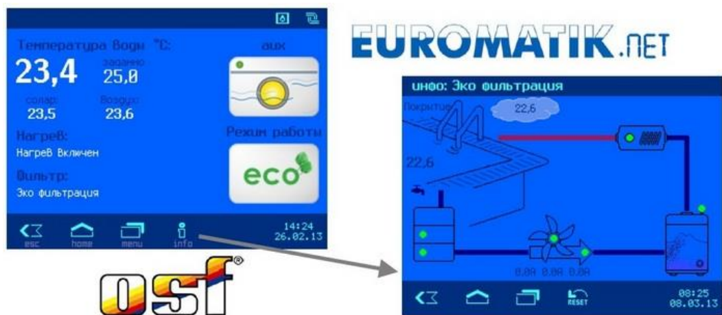
Рисунок 3 – Управление нагревом воды в бассейне