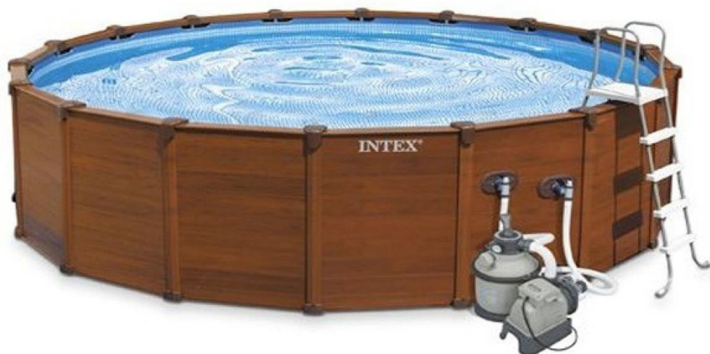
Рисунок 1 - Каркасный бассейн

Каркасные бассейны – это прекрасный вариант для участка. Установка стационарного бетонного бассейна – процесс достаточно трудоемкий и может занять много времени. А установка каркасных бассейнов, изготовленных по специальной технологии, займет до одного часа и не потребует наличия специальных знаний. Такие бассейны производятся самых различных форм, объема, имеют разную высоту. Каркас в данном случае достаточно крепок, чтобы выдержать купание нескольких человек.