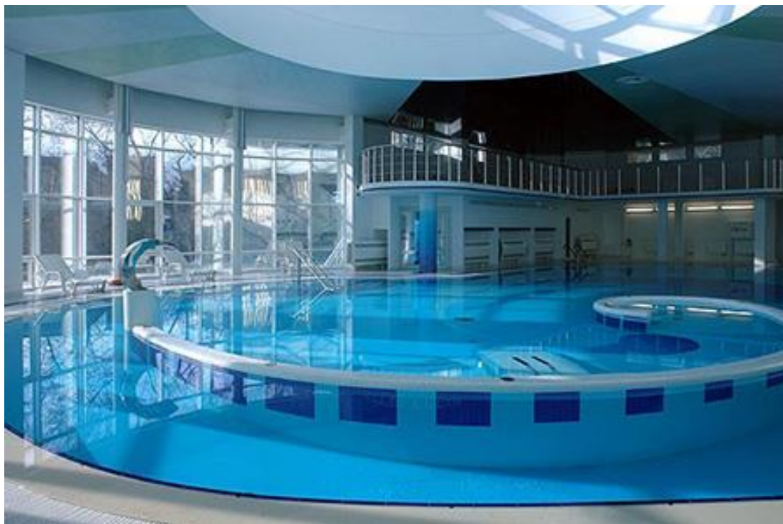
Рисунок 4 – Бассейн от компании GrandSmartHome

Контроль содержания реагентов самоочистки: Химическая очистка воды в бассейне играет очень важную роль для здоровья человека. Автоматизированный контроль за уровнем реагентов самоочистки в воде бассейна поможет предотвратить развитие опасных бактерий и поддерживать её чистоту.