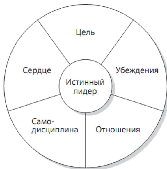
Рис. 2 – Признаки истинного лидера

Итак, какими характеристиками обладает лидер (рис 2).