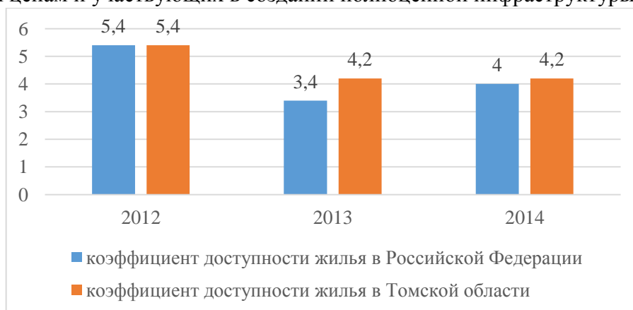
Рисунок 1- Изменение коэффициента доступности жилья