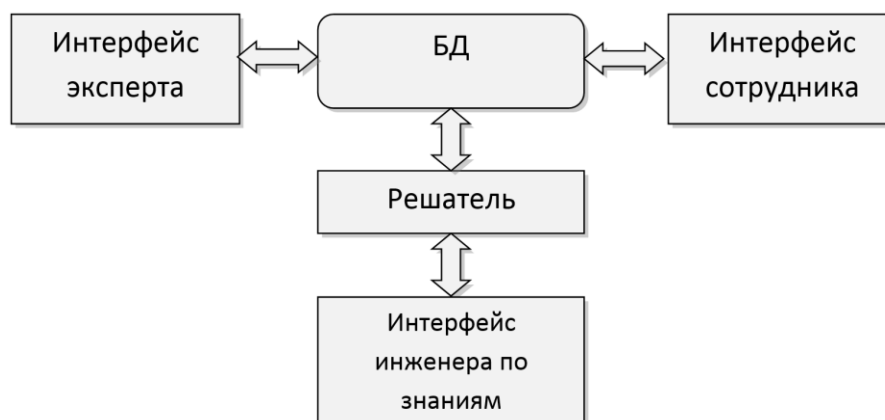
Рис.1. Структура экспертной системы

Структура экспертной системы. Основываясь на всех требованиях к ЭС, была разработана следующая структура ЭС, представленная на рисунке 1.