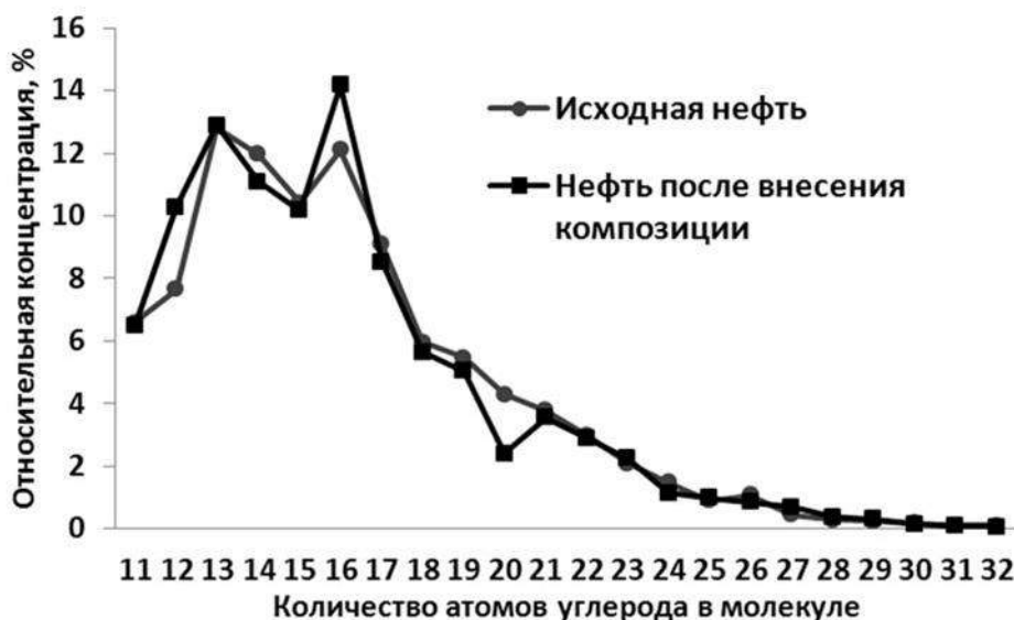
Рис. Молекулярно-массовое распределение n-алканов в исследованной нефти

Устойчивость порфиринового макроцикла обеспечила сохранность тетрапиррольных пигментов в различных геологических условиях. Различная реакционная способность периферических групп хлорофиллов и геминов позволяет установить основные факторы, под воздействием которых происходила трансформация органического материала, и определяет возможность использования данных о составе тетрапиррольных пигментов в качестве индикаторов условий накопления органического вещества и путей формирования месторождений каустобиолитов. В частности, данные о составе и особенностях строения нефтяных порфиринов могут способствовать повышению эффективности нефтеразведочных работ, а также решению проблем, связанных с происхождением нефти. Большое внимание исследователей к этим соединениям объясняется тем, что, будучи составными структурами биохимически важных соединений, они служат свидетелями геохимической истории той или иной осадочной породы, а также генезиса горючих полезных ископаемых [4]. В связи с этим представляет интерес исследование влияния физико-химических методов увеличения нефтеотдачи на содержание порфиринов в нефти.