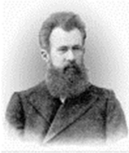
Фото 1. Академик В.А. Обручев – основатель горно-геологического образования в ТПИ (ТПУ) и Сибири

Национальный исследовательский Томский политехнический университет, г. Томск, Россия