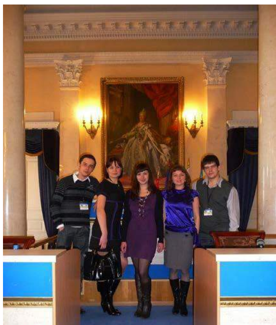
Фото 6. 2010 г. Лауреаты звания «Лучшие выпускники России по специальностям» – выпускники ИПР ТПУ после вручения наград (г. Санкт-Петербург)

поддержка студенческой науки. Именно денежные фонды наследия профессора К.В. Радугина и профессора А.В. Аксарина сыграли положительную роль в наиболее трудный период для института. В настоящее время студенты, аспиранты и молодые ученые ИПР активно участвуют в конкурсах грантов различного уровня на проведение научно-исследовательских работ и выигрывают их. Ежегодно студенты ИПР зарабатывают от 10 до 20 млн. рублей.