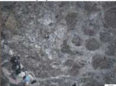
Рис. 2. Известняк микритовый пеллоидный (пакстоун)