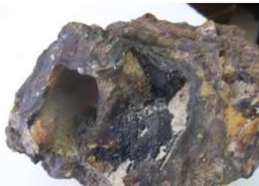
Рис. 8. Выделения твердого битума в центральной части лимонитового желвака из коры выветривания

Таким образом, северо-восток Колывань-Томской складчатой зоны в среднем девоне представлял собой мелководный нормально-соленый морской бассейн, в котором шло формирование рифогенных массивов, породы которых могли бы служить коллекторами для углеводорода при сохранении надежных покрывшек.