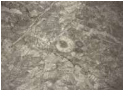
Рис. 1. Известняк биогермный (баундстоун)