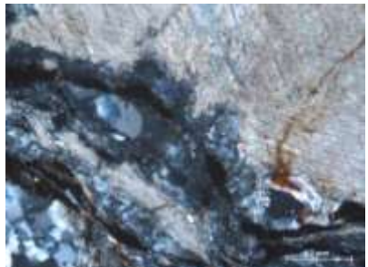
Рис. 6. Известняки мраморизованные, кремненные

Карбонатные породы карьера «Подломск» представлены следующими разновидностями: известняки биогермные (баундстоуны) с многочисленными микростилолитами и участками перекристаллизации (рис. 4);