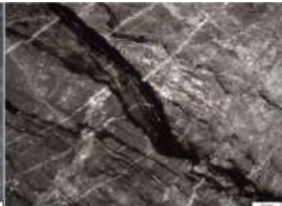
Рис. 3. Известняк слойчатый (мадстоун)