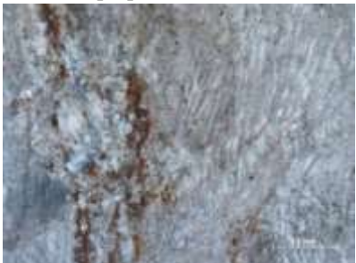
Рис. 5. Известняки органогенные глинистые (мадстоун)