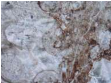
Рис. 4. Известняки биогермные (баундстоун)