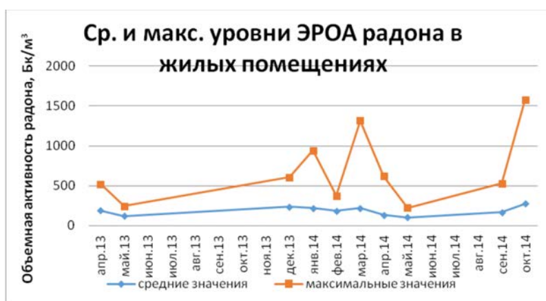
Рис. 2. Сравнительный график средних и максимальных значений ЭРОА радона в жилых помещениях села Калачи по результатам отчета “Экологические исследования на территории села Калачи Есильского района Акмолинской области”

дон проявляет более сильный наркотический эффект, чем криптон, который давно используется в медицине в качестве анестетика, однако использование радона из-за радиоактивности в качестве анестетика не известно.