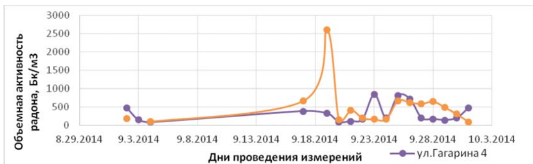
Рис. 1. Результаты суточных измерений радона в нескольких домах с. Калачи (график построен по результатам отчета “Экологические исследования на территории села Калачи Есильского района Акмолинской области”)