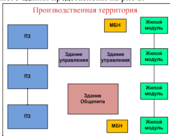
Рисунок 1 – Производственное здание

Схема блочно-модульного здания и внешний вид производственного здания представлены на рис 2.