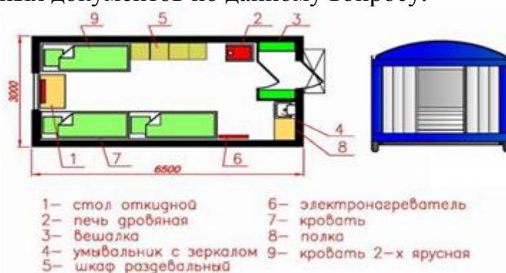
Рисунок 2 – Жилое, блочно-модульное здание

также определение рисков функциональных помещений (жилые, производственные и т.д.). Так же необходимо провести анализ законодательных документов по данному вопросу.