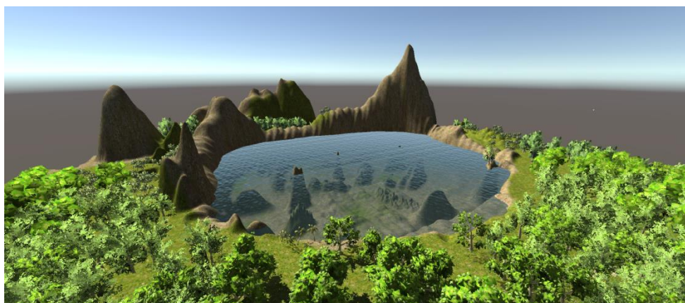
Рис. 2. Трехмерная модель акватории

Для достижения большей реалистичности изображения на модель ландшафта были наложены текстуры камня и травы из стандартной библиотеки Unity, а так же добавлены различные 3D объекты, такие как деревья, кусты и т. д. Кроме того были использованы шейдеры для создания подводной обстановки. Предусмотрена возможность управления аппаратом с камерой от третьего лица, для которой включен параметр «дальность видимости» реализованный при помощи шейдера GlobalFog. При помощи контроллеров Rigidbody и Mesh Collider для объектов были реализованы такие физические свойства, как возможность столкновения с другими объектами и рельефом, и воздействие гравитации.