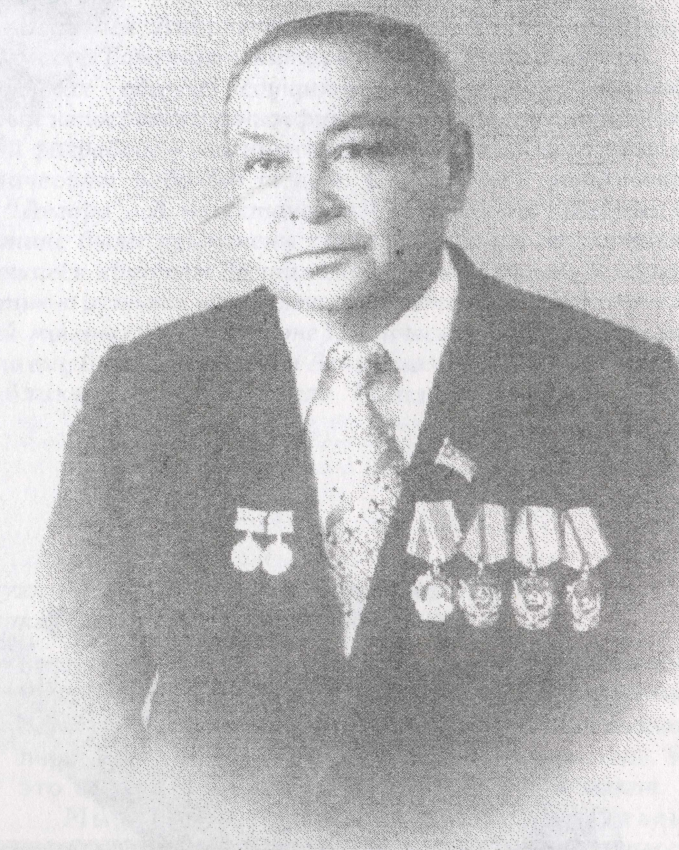
Такежанов Саук Темирбаевич, Президент Ассоциации "Казметалл", Крупный государственный деятель Казахстана. Был министром цветной металлургии, председателем Госплана республики, возглавлял Комитет Верховного Совета Республики Казахстан по вопросам экономической реформы, бюджета и финансов. Лауреат Госпремии СССР 1985 г. Выпускник ФТФ ТПИ 1956 г.

В последующем, в практической работе в цехах, на предприятиях, в целом в отрасли, на