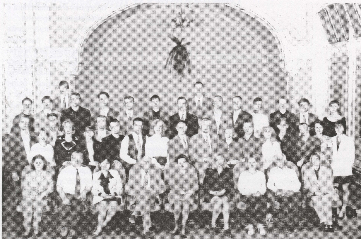
Выпуск студентов Русско-Американского центра ТПУ, 1999 г.