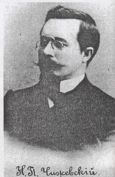
Чижевский Н.П. - профессор, Лауреат Государственной премии, академик АН СССР. Работал в ТПИ с 1909г. по 1923г. Крупный специалист по металлургии черных металлов. Исследовал влияние азота, кремния и марганца на механические свойства сталей.