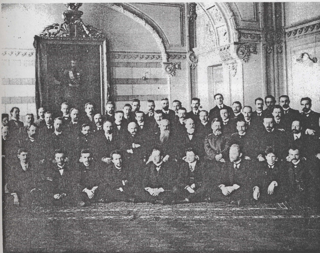
Профессорско-преподавательский состав ТТИ, 1910 г.