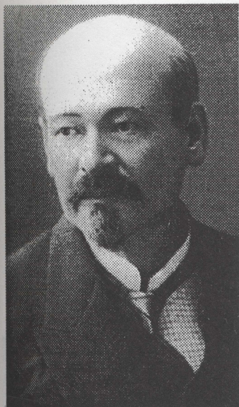
Кижнер Н.М. - профессор, доктор, Почетный академик АН СССР. Зав. кафедрой органической химии с 1901 по 1913 гг. Выпускник Московского Университета (1890), ученик выдающегося химика-органика В. В. Марковникова.