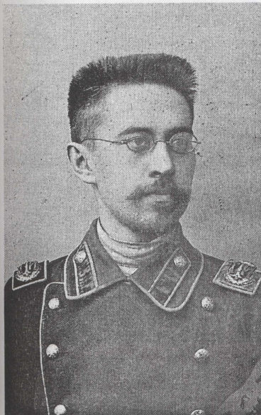
И.Н.Бутаков (1881 – 1970 гг.) инженер-механик, заслуженный деятель науки и техники РСФСР, профессор, доктор, крупнейший теплоэнергетик Сибири. Первый выпускник механического отделения ТТИ 1906 г. Работал в ТПИ (ТПУ) с 1918 по 1970 г.