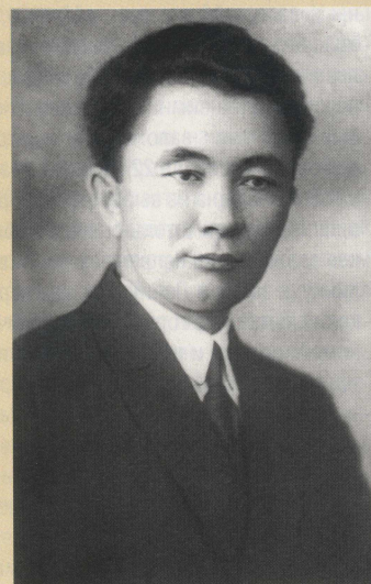
К.И.Сатпаев , академик АН СССР, АН Казахстана, организатор и первый президент Казахской Академии наук. Выпускник СТИ (ТПУ) 1926 г. Первооткрыватель марганцевого месторождения Джезды (1929 г.), лауреат Ленинской и Государственной премий СССР.