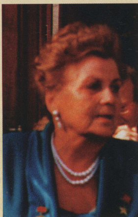
Стеблева Г.С. , первооткрыватель Горевского полиметаллического месторождения (1956 г.), лауреат Ленинской премии (1956), Герой Социалистического Труда (1971), вып. ГРФ 1948 г.