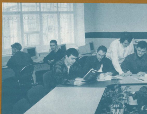
Занятия в Языковом центре студентов АЭМФ

На факультете обучаются 5 иностранных студентов из республик Корея, Пакистан и Кипр, 2 из них учатся уже на третьем курсе.