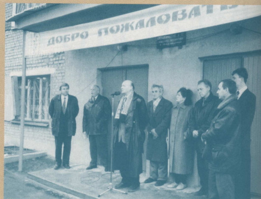
Открытие общезития АЭМФ после реконструкции, 19 октября 1996 г.

Магистерская подготовка ведется по направлениям: материаловедение в электротехнике и радиотехнике; технология проектирования и производства преобразователей энергии; электроприводы и системы управления электроприводами; электромеханические си-