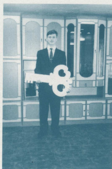
Символический ключ общезития АЭМФ вручен председателю студсовета, 19 октября 1996 г.