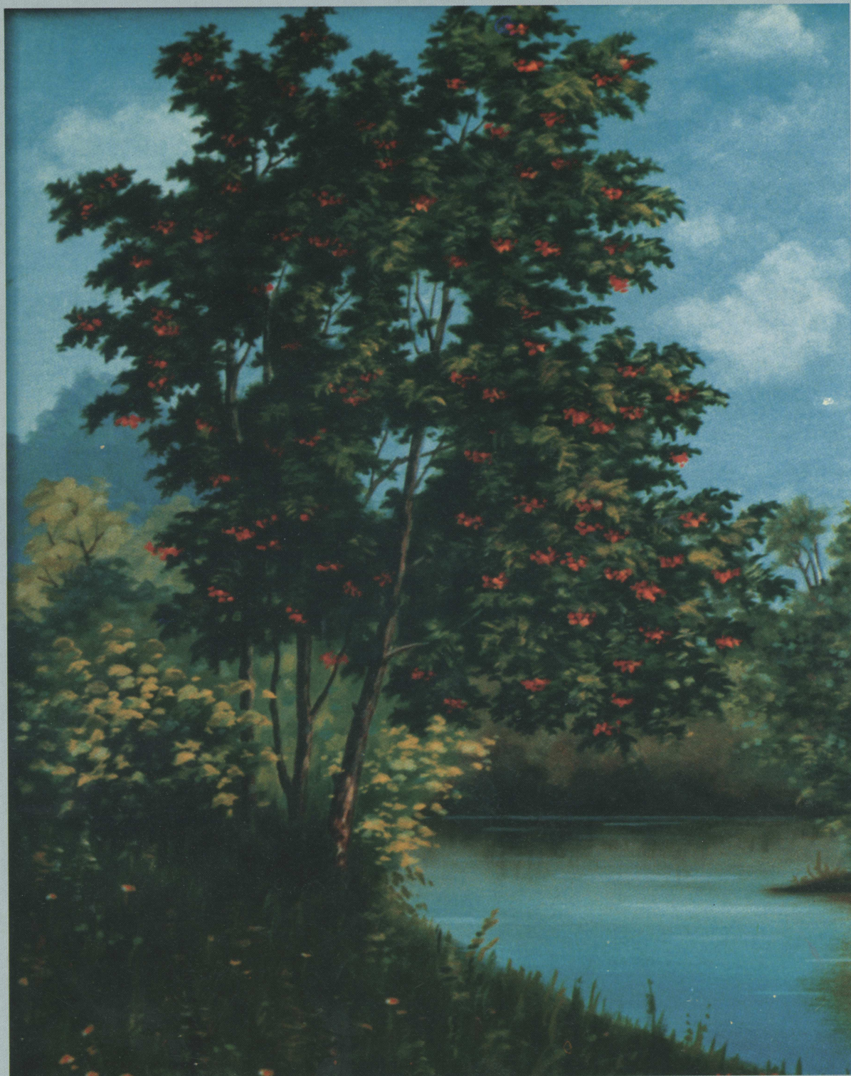
Кудрявая рябина Ох, рябина кудрявая, Ох, рябина могучая, Полюбила бы парня я, только нету случая.