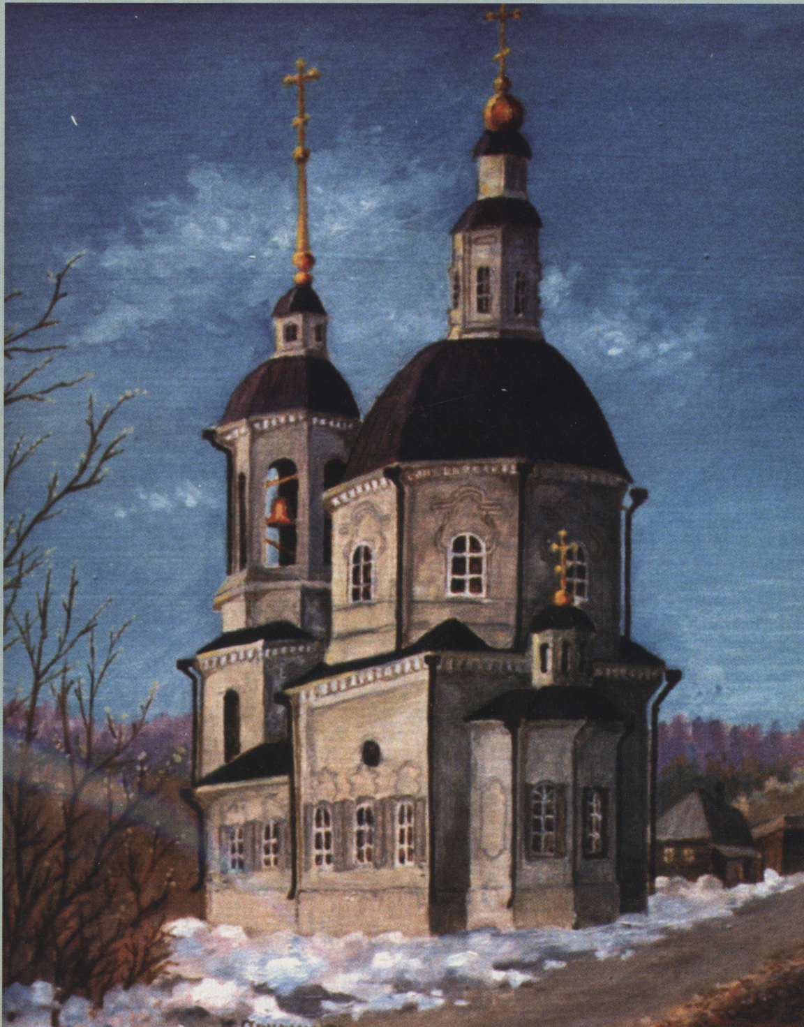
Спасская церковь Пусть красота не канет в лету Всегда, не только в воскресенье, Колокола на церкви этой Пусть возвестят о возрожденьи.