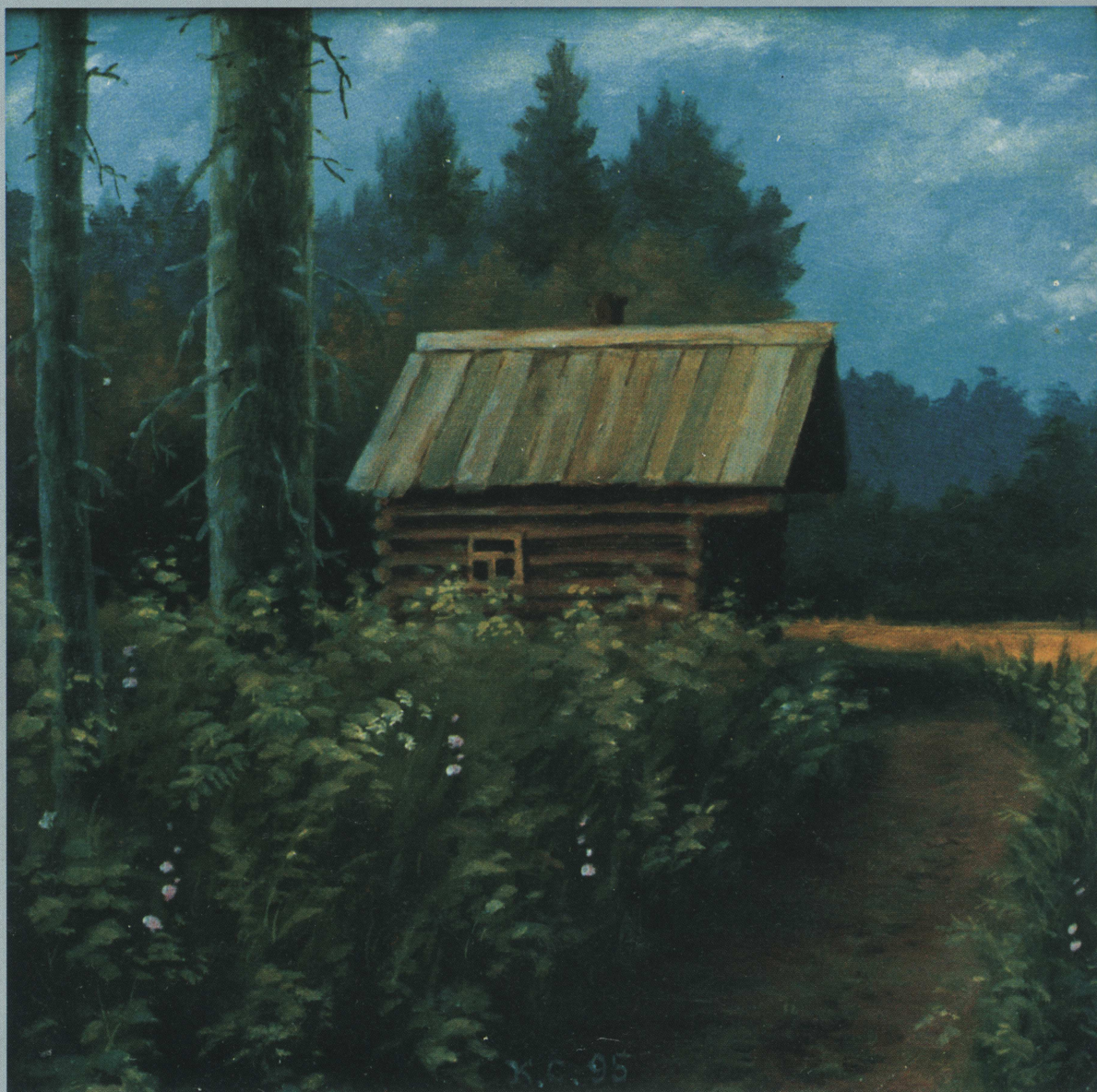
Зимовье Непогоды не боюсь Ни зимой ни летом. отогреюсь, отосплюсь Я в зимовье этом.