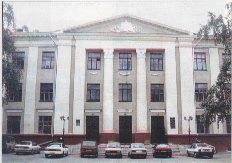
Учебный корпус № 8

tools, which are necessary for the process of studying, repairing works as a technical aid. Traditions of education at this Faculty allow to face "tomorrow" of Russian Economics with hope confidence.