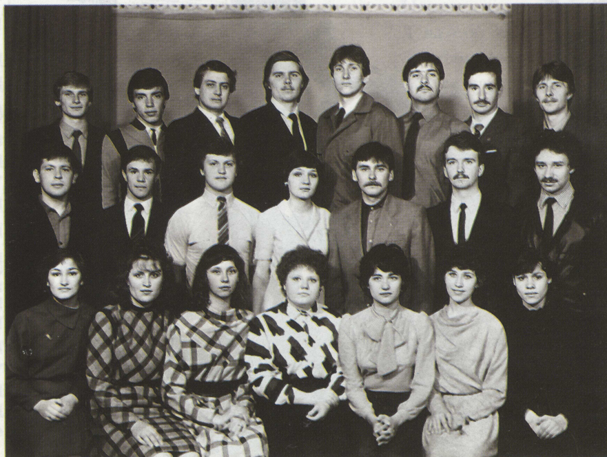
Первый выпуск инженеров-робототехников (гр.8411), 1987 г.

The Faculty witnessed substantial changes in its academic process ten years ago. It was the first in TPU to start multilevel educational programmes. First Bachelors graduated from the