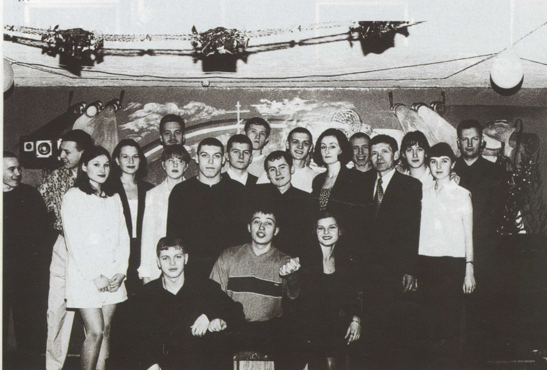
Студсовет и КВН АВТФ.

One of the greatest problems of the Faculty is the shortage of up-to-date equipment to train highly qualified specialists in engineering. Graduates of the Faculty help it to solve the problem but there should be centralised support.