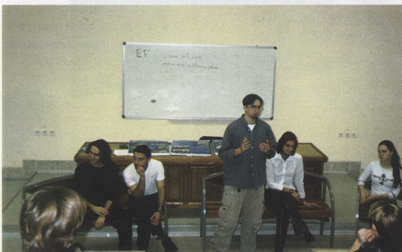
Студенческий Турклуб при Гуманитарном факультете

Today the faculty offers programmes for full-time and part-time students.