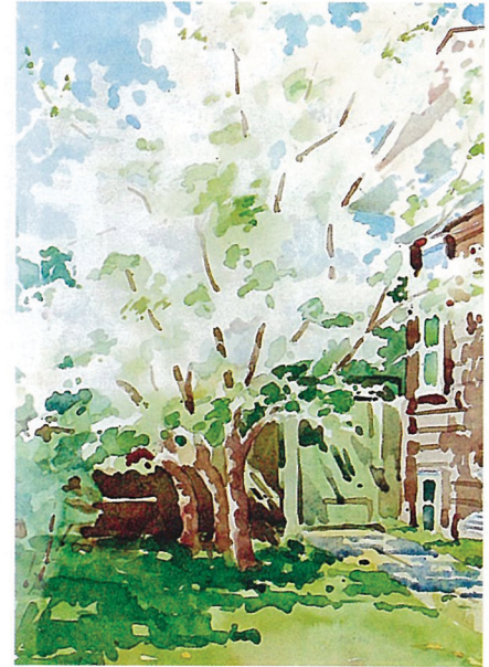
В.М. Мизеров. Яблони цветут.

Сергей Иванович Голубин (1870-1956) - ученик И.Е. Репина