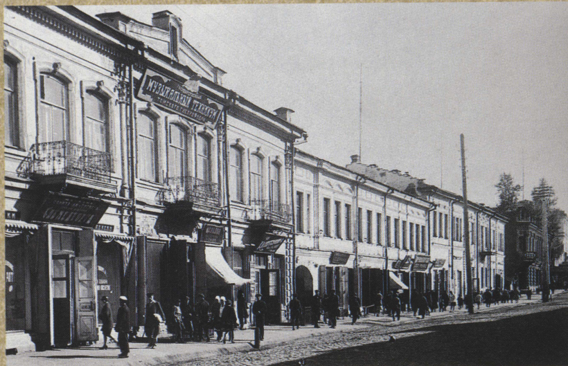
Здание Томского музыкального техникума (30-е годы)