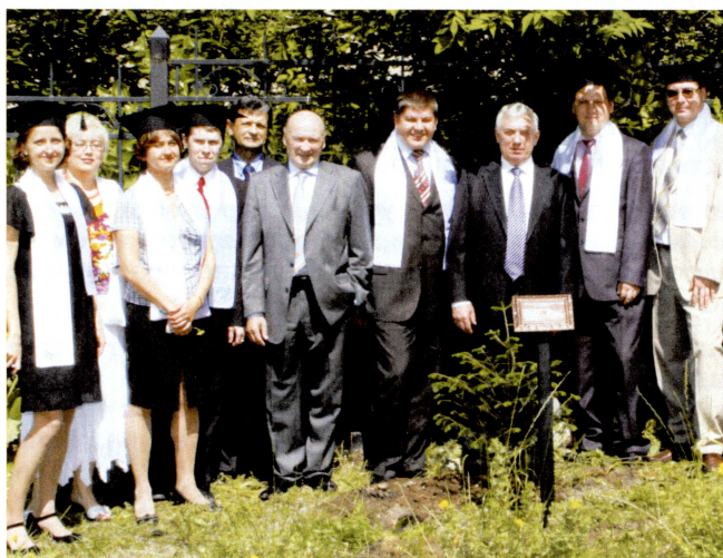
Первый выпуск магистров программы «Менеджмент в научно-образовательной сфере». Закладка аллеи магистра.