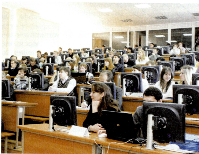
Современная учебная аудитория

Планируется внедрение в образовательный процесс технологий электронного обучения; программных и программно-технических комплексов организации лабораторно-практических занятий, связанных с моделированием и управлением на физических и математических моделях, построением автоматизированных измерительных систем; на внедрение современных систем автоматизации проектирования, виртуальной инженерии и промышленного дизайна.