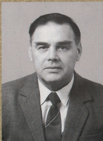
Курленя М.В. Специалист в области горной механики. Академик РАН. Лауреат Госпремии СССР. Директор Института горного дела СО РАН. Выпускник горно-механического факультета ТПИ 1953 г.