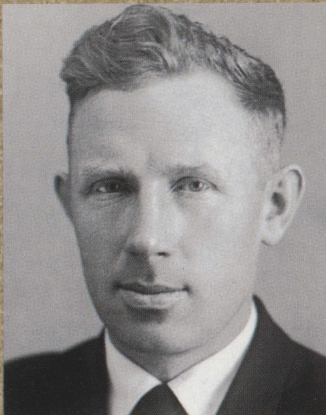
Алимов О.Д. Доктор технических наук, действительный член АН Киргизии. Лауреат Госпремии СССР. Выпускник МСФ ТПУ 1949 г.