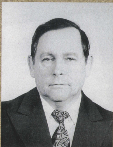
Околович В.Н. Академик АН Казахстана, Вице-президент АН Казахстана. Выпускник ФТФ ТПИ 1956 г. Почетный выпускник ТПУ.