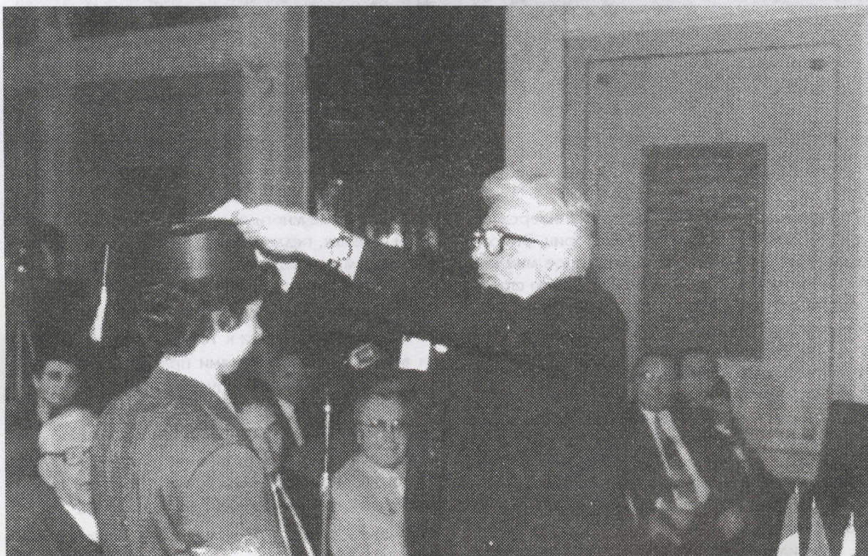
Академик Г.А.Месяц награждает именно стипендиата ТПУ, май 1996 г.