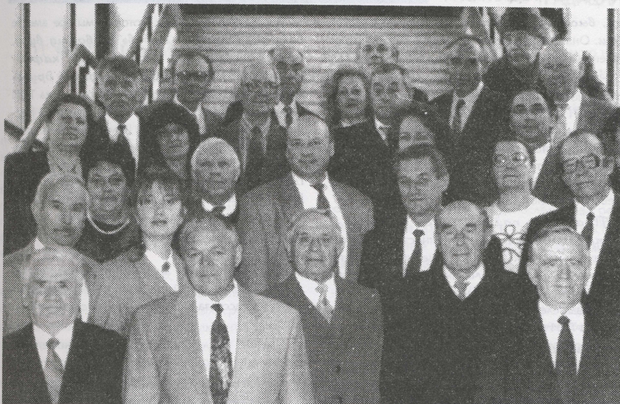
Политехники в гостях у московского землячества, 23 сентября 1995 г.