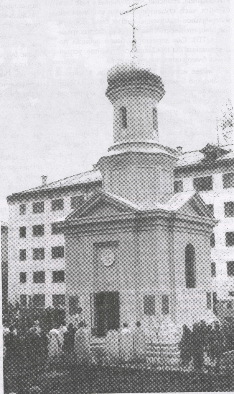
Открытие часовни Святой Домны Томской на территории студгородка ТПУ, май 1996 г.