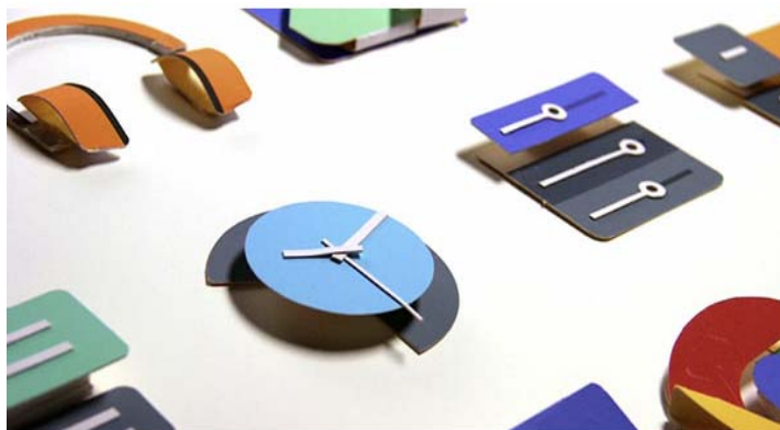
Рис. 1. Метафоры плоской бумаги [2]

Для чего предназначен материальный дизайн. Он служит двум целям: унификации многочисленных продуктов компании и унификации интерфейсов приложений для Android. После засилья скеоморфизма веб-интерфейсы шатнулись в сторону радикального уплощения, но это оказалось просто ещё одной крайностью. В Google решили, что чтобы быть понятными и интернациональными, объекты интерфейса должны иметь аналог, метафору в реальном мире. Такой метафорой стала бумага. Тонкая, плоская, но расположенная в трехмерном пространстве и имеющая тени, скорость движения, ускорение. Но бумага «квантовая», не настоящая (рис. 1). Она подчиняется физическим законам, но имеет и волшебные свойства. Это помогает показать пользователю принципы работы ПО, как происходит переход от одного к другому состоянию. Анимации тут не просто оживляют интерфейс, но показывают пользователю, что происходит.