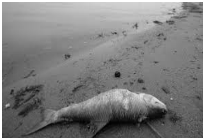
Рис. 1. Результат воздействия кислотных дождей на флору и фауну

Первая и вторая стадии обратимы при условии прекращения выпадения кислотных дождей. С накоплением органических веществ на дне водоемов, из них начинают выщелачиваться токсичные металлы. Повышение кислотности воды влечет за собой увеличение растворимости некоторых опасных веществ, таких как, алюминий, ртуть, кадмий и свинец из донных отложений и почв.