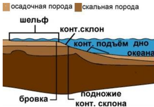
Рисунок 1 – Строение шельфа

Береговая линия (со стороны суши) и бровка (по перегибу с океанской стороны, ниже которой глубины дна резко возрастают) считаются границами шельфа.