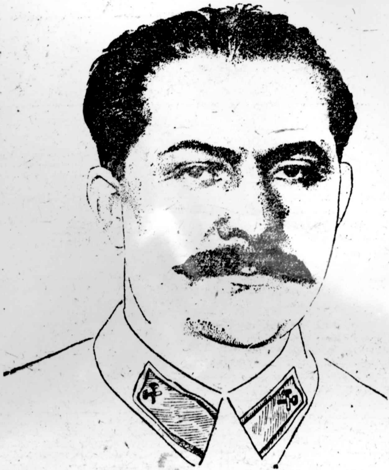
Народный комиссар путей сообщения Л. М. Каганович

„Рабочие-стахановцы, все партийные и профессиональные организации должны, в первую очередь, бороться за установление железной пролетарской трудовой дисциплины на Томской дороге. Выполнить решения декабрьского пленума ЦК ВКП(б) о стахановском движении, поднять технический уровень рабочих, в первую очередь, молодежи, и сделать Томскую передовую дорогу, крепостью советского железнодорожного транспорта на востоке“.