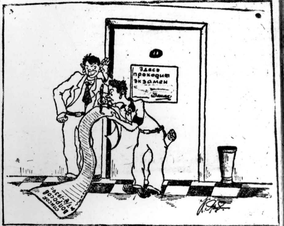
а у некоторых — на трафарет экзаминатора.