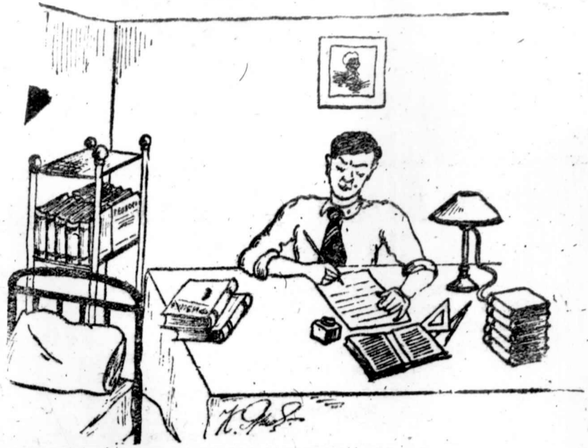
у большинства — на свои силы,