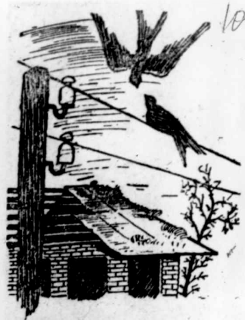
Рисунок Ю. Левченко.