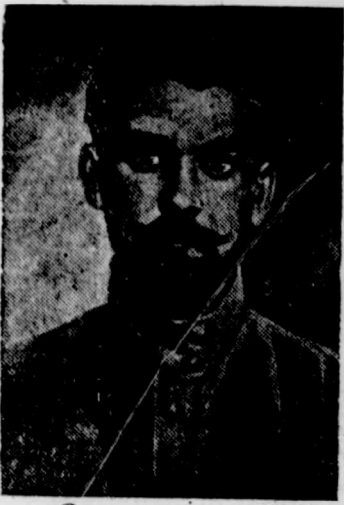
Н. А. Щорс