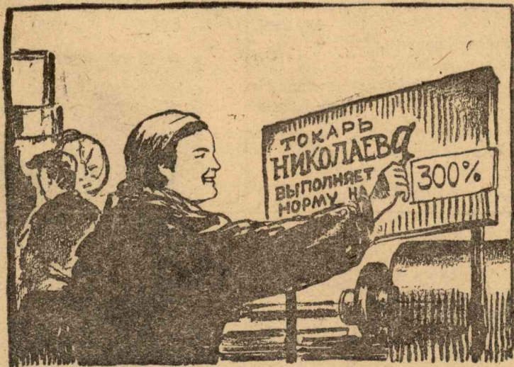
— Припишу эту букву, а все остальное у меня останется попрежнему...

Советские патриотки овладевают профессиями, которые считались „мужскими“, сменяют у станка своих мужей, ушедших в Красную Армию, работают по-стахановски. (Из газет).