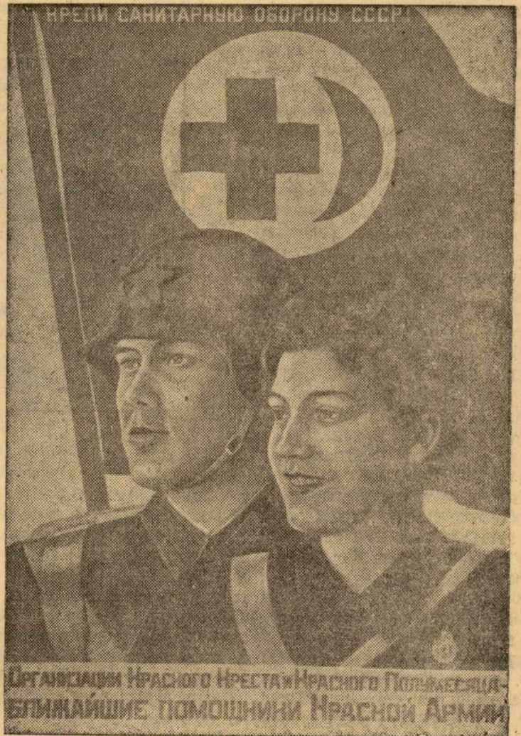
Плакат работы художника В. Корецкого выпущенный издательством "Искусство".