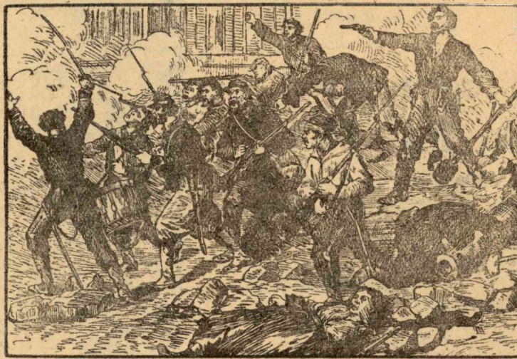
В последний бой (1871 г.)

Вместо того, чтобы сразу же после взятия власти пойти в наступление на Версаль и разгромить это основное гнездо руководителей Комму-