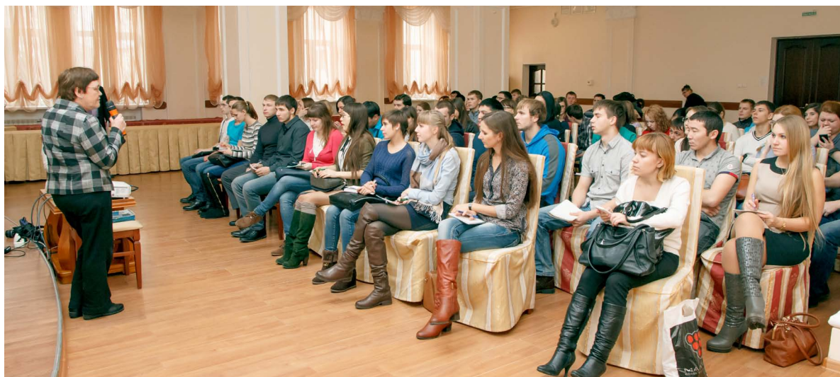
Проведение мастер-класса для студентов ТПУ