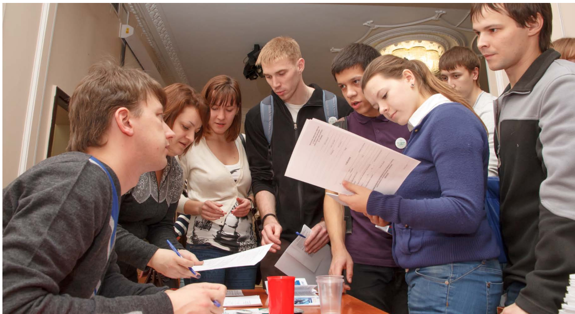
Ярмарка вакансий в Международном культурном центре ТПУ