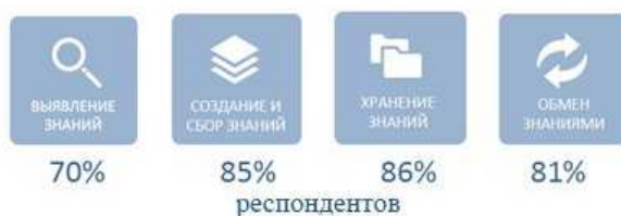
Рис. 2. Внимание к отдельным процессам управления знаниями среди российских компаний

Третий парадокс заключается в том, что руководство российских компаний не в равной степени уделяет внимание разным этапам управления знаниями (рис. 2).