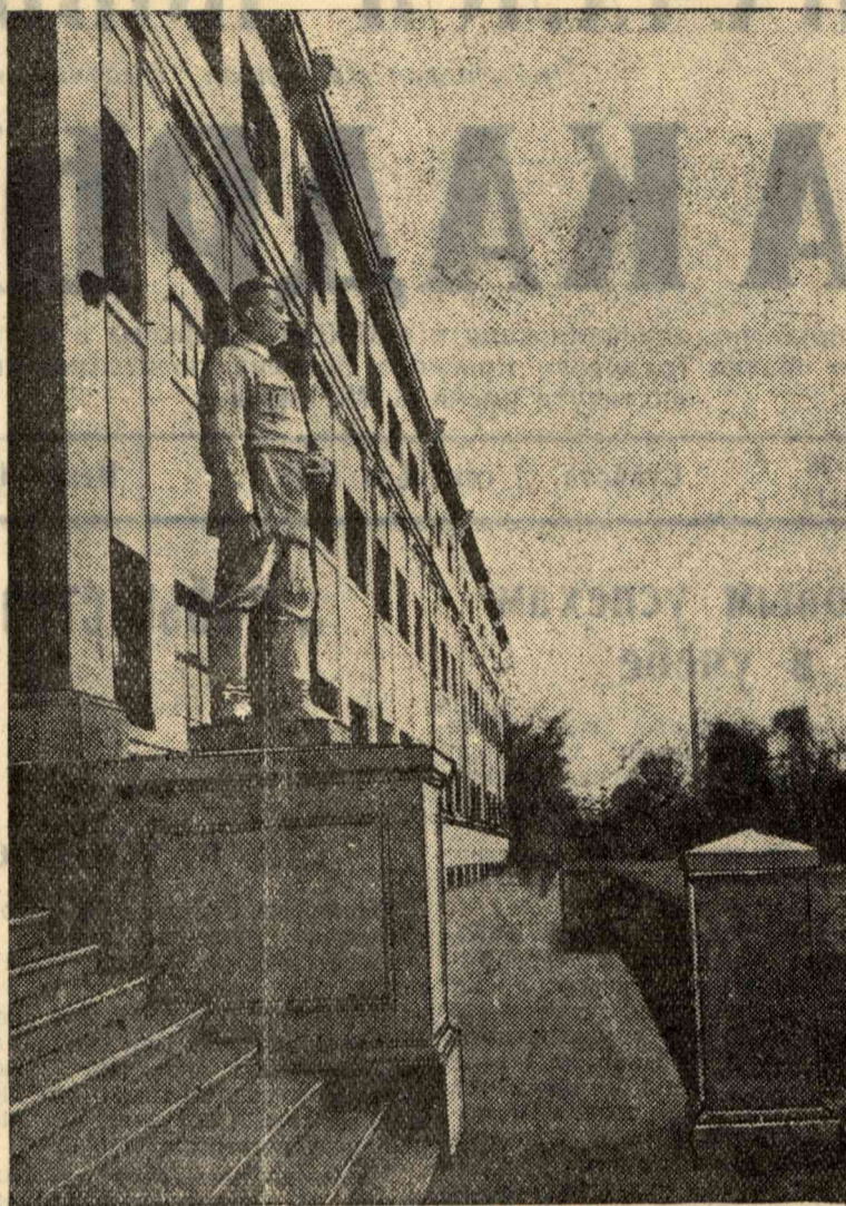
Новый горный корпус нашего института. Здесь готовятся горные инженеры.

Тов. Виноградову посоветовали взять свое заявление об отчислении из института обратно, а самому настойчивым и