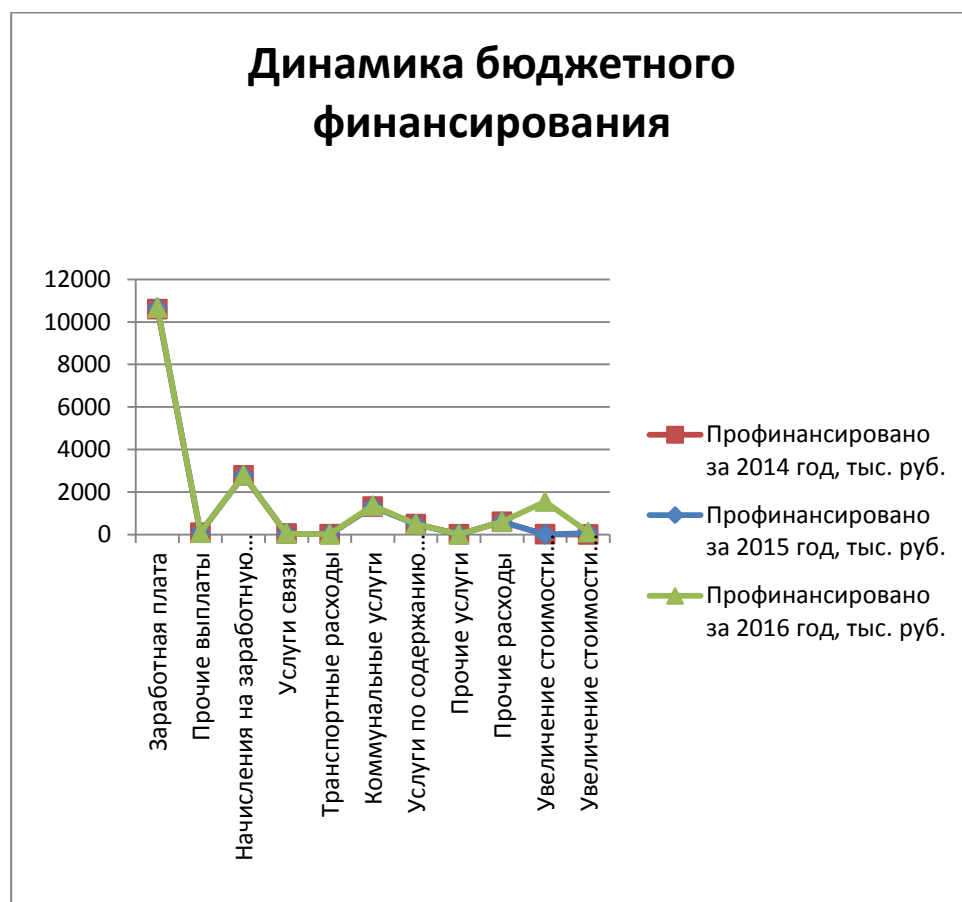
Рисунок 2 – Динамика бюджетного финансирования МБУДО «Детская школа искусств №10» за 2014-2016 г

Графы 3, 6, 9 содержат суммы фактического финансирования, предоставленного МБУДО. По большинству статей отклонение фактических данных финансирования от плановых отсутствует, что говорит о достоверности планирования показателей сметы. За исключением некоторых статей, таких как транспортные расходы. Неисполнение составило 0,2%.