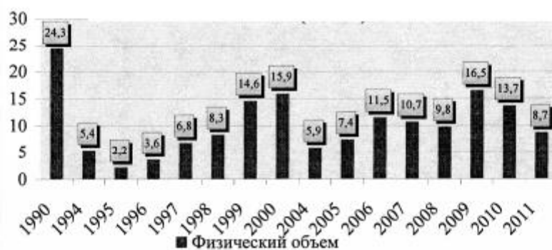
Рис. 3. Физический объем экспорта мяса и мясопродуктов из Монголии, тыс. т

Интенсификация торговых и партнерских отношений России и Монголии возможна при комплексной реализации следующих мер: