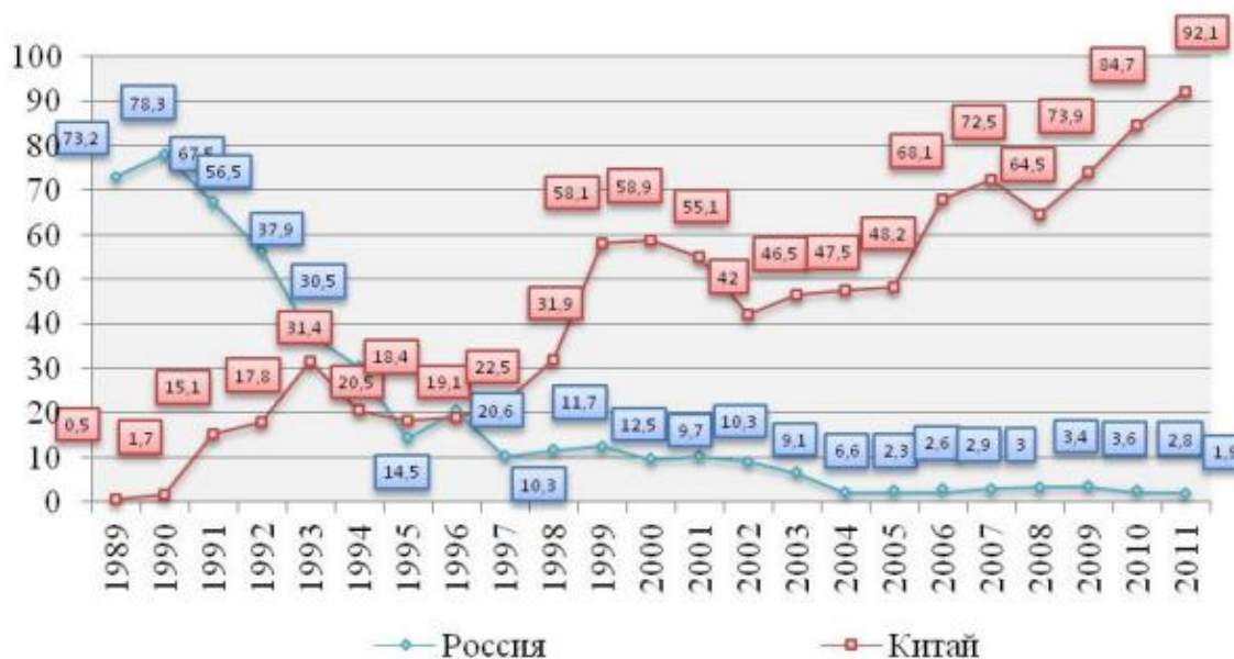
Рис. 1. Динамика долей РФ и КНР в общем экспорте Монголии, %

Статистические данные демонстрируют, что Монгольский экспорт в Россию практически прекратился 50 . Данная ситуация обусловлена комплексом проблем, (высокие транспортные железнодорожные тарифы, жесткие санитарно-ветеринарные требования, невысокая конкурентоспособность экспортируемых на российский рынок монгольских товаров и т.д.), требующих системного подхода и целенаправленного решения.