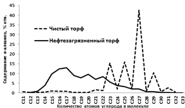
Рис. 1. Молекулярно-массовое распределение н-алканов в чистом и нефтезагрязненном торфах

В чистой воде максимально содержание гомологов C_{25} и C_{27} . Молекулярно-массовое распределение н-алканов на участке от C_{23} до