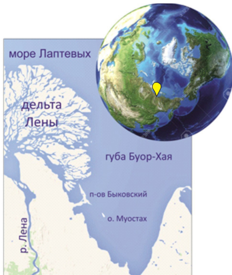
Рис. 1. Положение района исследований

Фактическим материалом для работы послужили пробы донных осадков, отобранные в юго-восточной части моря Лаптевых (губа Буор-Хая) в ходе морских и прибрежно-морских арктических экспедиций в период с 2014 по 2016 гг. (рис. 1). В качестве технических средств пробоотбора использовались дночерпатели типа Van Veen, прямоточные гравитационные трубки, боксорер. Гранулометрический анализ донных осадков выполнялся на лазерном дифракционном микроанализаторе «Analysette 22 Fritsch» в лаборатории арктических исследований ТОИ ДВО РАН, а также методом классического водно-механического анализа [1]. Литологическая типизация осадков и взвеси проводилась на основе трехкомпонентной классификации по соотношению содержания фракций песка Ps (1-0,1 мм), алеврита A (0,1-0,01 мм) и пелита Pl (<0,01 мм) [3].