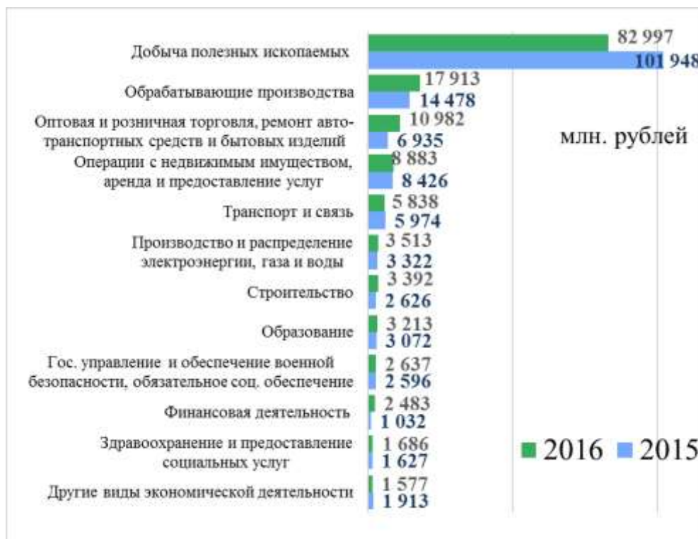
Рисунок 2 – Отраслевая структура налоговых доходов консолидированного бюджета Российской Федерации, поступающих с территории Томской области

третье место в 2015 году – 8 426 млн рублей (5,4%) и четвертое в 2016 году – 8 883 млн рублей (6,1%).