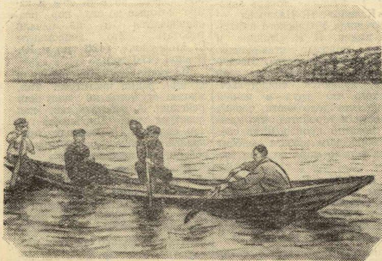
Работа на сегодня окончена. Бригада возвращается на базу. На снимке запечатлен момент переправы через реку Томь.